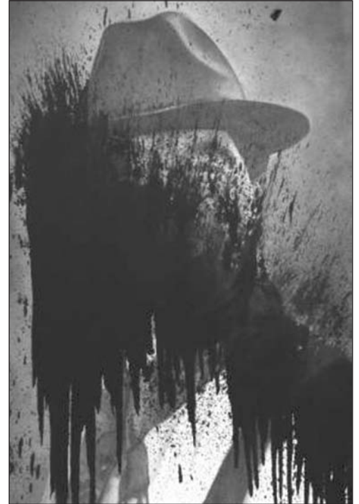
কালি নয়, একরাশ ক্ষোভ ঢেলে দেয়া হয়েছে ছবিতে