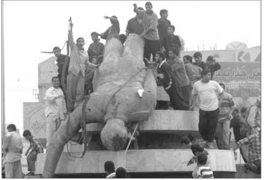
সাদ্দামের মূর্তি নিয়ে গুটিকতক লোকের উল্লাস পুরো ইরাকের প্রতিচ্ছবি নয়

এক্ষেত্রে তিনি কেবল সিরিয়াতেই যেতে পারেন। ইরানে যাওয়ার সুযোগ থাকলেও ইরান সরকার কটর সাদ্দাম বিরোধী। তারা সাদ্দামকে ইরানে ঢুকতে দেবে না। অন্যদিকে ইরাকের দক্ষিণ-পশ্চিমাঞ্চল আত্মসী জোটবাহিনীর হাতে চলে যাওয়ায় সেই পথ ব্যবহার করে সৌদি আরবে আশ্রয় নেয়ার সুযোগ নেই। কিন্তু আরব দেশগুলোর মধ্যে একমাত্র সৌদি আরবই এখন প্রকাশ্যে সাদ্দামকে রাজনৈতিক আশ্রয় দিতে পারে। ইরাক আক্রান্ত হওয়ার আগে এধরনের একটি প্রস্তাব সৌদি আরব দিলেও সাদ্দাম তা প্রত্যাখ্যান করেছেন। বর্তমানে সাদ্দাম হোসেন যদি সিরিয়া বা অন্যকোনো পথে সৌদি আরবে যেতে পারেন। মার্কিন হুমকি উপেক্ষা করে সাদ্দামকে সৌদি আরব আশ্রয় দেয়ার ক্ষমতা রাখে। মার্কিন যুক্তরাষ্ট্র মধ্যপ্রাচ্যে তাদের সবচেয়ে ঘনিষ্ঠ আরবমিত্র এবং বিশ্বের সবচেয়ে বড় তেল মজুদের দেশের গায়ে হাত তুলতে সাহস করবে না। কিন্তু সিরিয়ার ব্যাপারটি ভিন্ন। সিরিয়া সাদ্দামকে আশ্রয় দিয়েছে এই অজুহাত তুলে যুক্তরাষ্ট্র সহজেই সিরিয়া আক্রমণকে হালাল করে ফেলতে পারে। প্রতিরক্ষামন্ত্রী ডোনাল্ড রামসফেল্ড প্রকাশ্যেই বলেছেন, ‘আমরা সিরিয়ার ওপর চোখ রাখছি। আমাদের প্রতি দামেস্ক ‘খারাপ আচরণ’ করেছে। ব্যাপারটি আমরা আক্রমণাত্মক হিসেবেও দেখতে পারি।’ এই হুমকির পর স্বাভাবিকভাবেই সিরিয়া সাদ্দাম ও তার কর্মকর্তাদের প্রকাশ্যে আশ্রয় দেয়ার সাহস দেখাবে না।