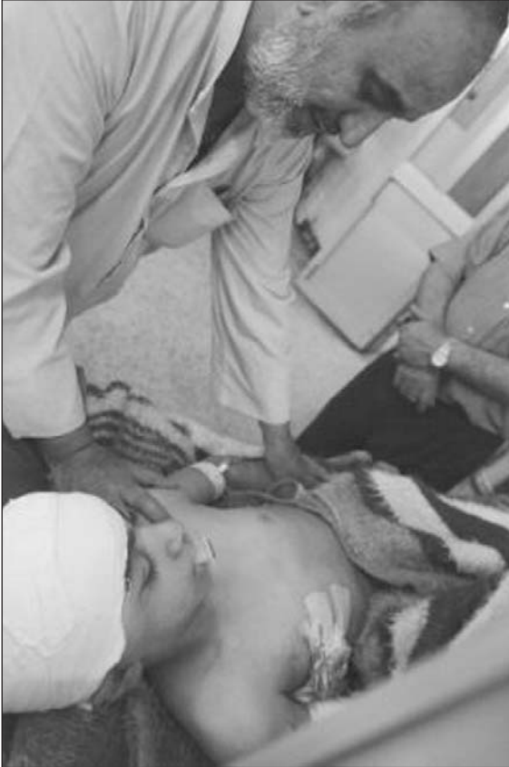
মার্কিনী হামলায় আহত ইরাকি শিশু