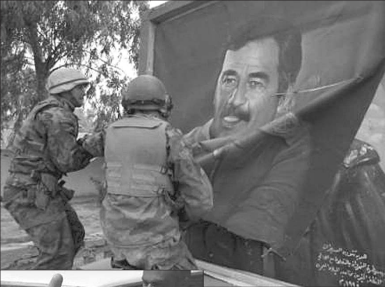
সাদ্দামের ছবি সরাসরি ব্যস্ত মার্কিন সৈন্য

এখানে সাদ্দাম ও তার স্ত্রী-পুত্রদের জন্য আলাদা বেডরুমে আছে। বাংকারটিতে পর্যাপ্ত পানি ও জ্বালানির সুব্যবস্থা আছে। এছাড়া আছে আমেরিকার তৈরি টার্বো ডিজেল ইলেকট্রিক পাওয়ার প্লান্ট। আরো আছে 'সেনিটেশন ব্লক' যা বাংকারের বাতাস ও পানিকে সব রকম পারমাণবিক, রাসায়নিক ও জীবাণু অস্ত্রের দূষণ থেকে রক্ষা করে। এছাড়াও আছে, অত্যাধুনিক 'কমান্ড সিস্টেম' যা থেকে সাদ্দাম তার পার্টি ও সেনাবাহিনীকে নির্দেশনা দিতে পারবেন। সেখানে ফরাসি