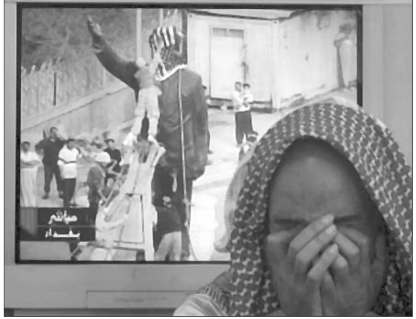
টিভিতে সাদ্দামের প্রতিমূর্তিকে মার্কিন পতাকায় ঢাকতে দেখে একজন জর্দানবাসীর কান্না

অবশ্য সাদ্দাম প্রচলিত পথ ব্যবহার করে তিকরিত যাবেন এমন সম্ভাবনা কম। অসমর্থিত সূত্রে বলা হয়েছে, সাদ্দাম ও তার পুত্ররা সাধারণ জনগণের ছদ্মবেশে ট্রাকে চেপে বাগদাদ থেকে তিকরিত চলে গেছেন। যেভাবেই হোক সাদ্দাম তিকরিত গিয়ে থাকলে, সেখানেই হবে তার শেষ লড়াই। সাদ্দামের প্রতি তিকরিতবাসীর আনুগত্য প্রশ্নাতীত। '৭০-এর দশকেও তিকরিত ছিল বঙ্গশিল্পকেন্দ্রিক ছোট্ট এক শহর। কিন্তু সাদ্দাম শহরটিকে গড়ে তোলেন নিজের মন মতো। বড় বড় শিল্পকারখানা স্থাপিত হয়। প্রশস্ত রাস্তা, আধুনিক আবাসিক এলাকাসহ বিভিন্ন অবকাঠামো নির্মাণ করা হয়। বর্তমানে তিকরিতের লোকসংখ্যা ২ লাখ ৫০ হাজার। সাদ্দামের মন্ত্রিসভার অধিকাংশ সদস্যই তিকরিতের। তাছাড়া স্পেশাল রিপাবলিকান গার্ড এবং ফেদাঈন যোদ্ধাদের প্রায় সবাই এসেছে এই শহর থেকে। এদের পরিবারের বছরের পর বছর ভরণপোষণ দিয়েছেন সাদ্দাম। অন্যদিকে, তিকরিতে রয়েছে রিপাবলিকান গার্ডের শক্ত ঘাঁটি। ইরাকের বিমান প্রশিক্ষণ কেন্দ্রও সেখানে। সবমিলিয়ে আগ্রাসন শুরু পর সাদ্দাম যে 'চূড়ান্ত লড়াইয়ের' কথা বলেছিলেন তার জন্য তিকরিত আদর্শ স্থান। মার্কিন সেনাবাহিনীও বলছে তিকরিতের চারপাশে রিপাবলিকান গার্ডরা