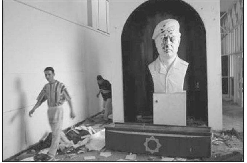
সাদ্দাম আর্ট গ্যালারীতে সাদ্দামের প্রতিকৃতি ভাঙচুর

এক্ষেত্রে দ্বিতীয় আরেকটি সম্ভাবনা রয়েছে। বাগদাদে প্রবেশের আগে জোটশক্তি রাজধানীতে ঢোকা বা বের হবার সমস্ত প্রধান পথই নিজেদের নিয়ন্ত্রণে নেয়। এসব পথে সাদ্দামের বাগদাদ ত্যাগ করার তাই প্রশ্নই আসে না। তাই সাদ্দাম যদি বাগদাদ ত্যাগ নাই