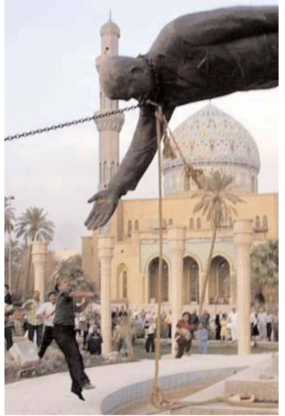
পতনের মুহূর্তেও ইরাকি জনগণের প্রতি শুভেচ্ছার হাত বাড়িয়ে রেখেছেন সাদ্দাম

মার্কিন সামরিক বিশেষজ্ঞরা অবশ্য ভিন্ন চিন্তা করছেন। তারা মনে করছেন, বাগদাদের প্রতিরোধ ব্যবস্থা এতো অল্পতেই ভেঙে পড়েছে সাদ্দাম মারা যাওয়াতে। সাদ্দাম যদি জীবিত