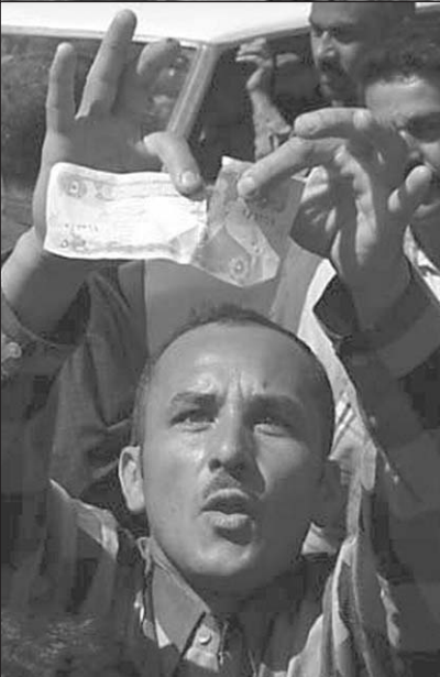
টাকায় সাদ্দামের প্রতিকৃতি ছিঁড়ছে

অবস্থান দেখে। কিভাবে এই ছাদটিকে এক রকম শূন্যে বুলন্ত অবস্থান রাখা সম্ভব হয়েছিল, সেটি ছিল সিভিল ইঞ্জিনিয়ারিংয়ের একটা মিরাকল।