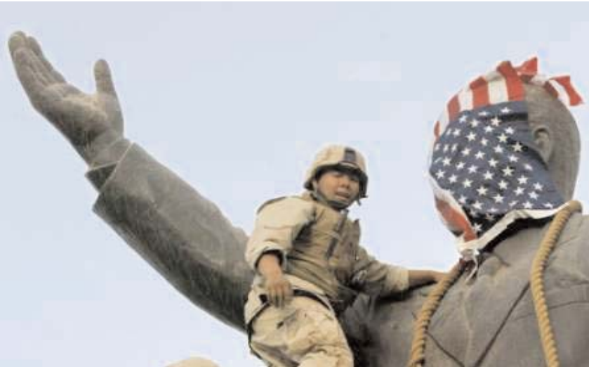
শুধু সাদ্দামের মূর্তিই নয়, পুরো ইরাক এখন মার্কিন পতাকার নিচে

১৯৭৬ সালে ভাইস প্রেসিডেন্ট থাকাকালে সাদ্দাম হোসেন যুগোল্লাভিয়া সফর করেন। মার্শাল টিটো তখন ক্ষমতায়। দক্ষিণ বসনিয়ার