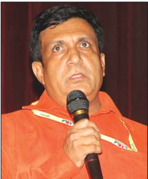
আমার ছবির পরিচালক শামীম আলম দীপেন