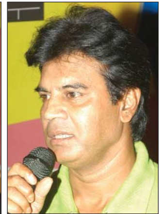
অভিনেতা ইলিয়াস কাঞ্চন

অনুষ্ঠানে অন্যান্যের মধ্যে আরো বক্তব্য রাখেন কথাসাহিত্যিক রাবেয়া খাতুন,