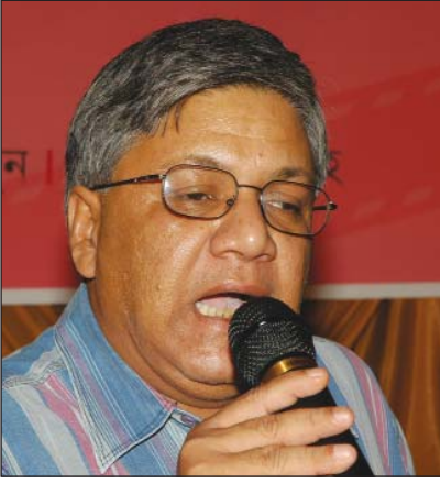
চলচ্চিত্র পরিচালক মোর্শেদুল ইসলাম