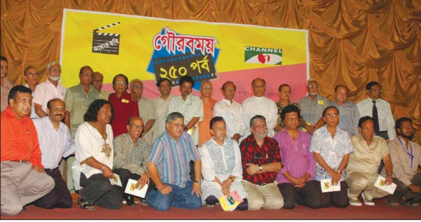
আমার ছবির কলাকুশলীর মাঝে শুভাকাঙ্ক্ষীরা