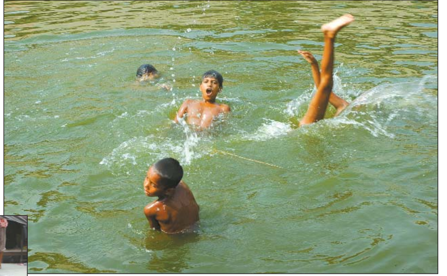
বুড়িগঙ্গা নদীতে খেলছে একদল কিশোর