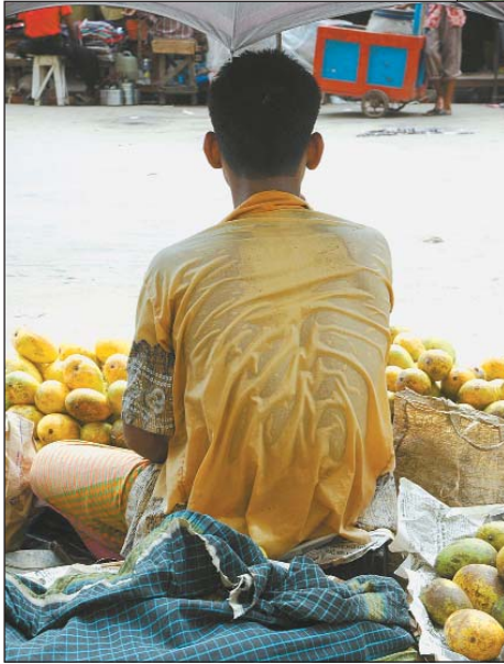
ইসলামপুর : ঘামে ভিজে গেছে পুরো শরীর