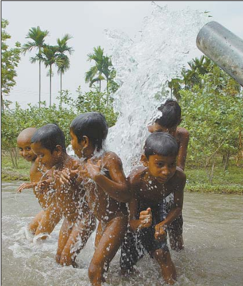
প্রচণ্ড গরমে একটু স্বস্তি চাই