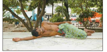
বাহাদুর শাহ পার্ক : একটু বিশ্রাম