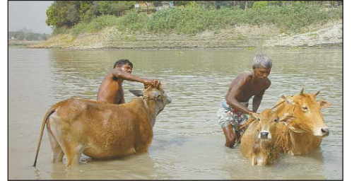
শুধু মানুষ নয়, গবাদি পশুও অতিষ্ঠ গরমে