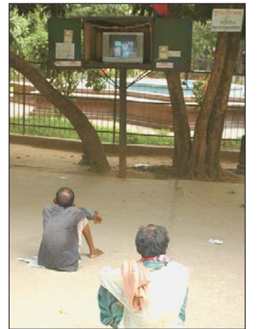
টিভি দেখা ও বিশ্রাম বাহাদুর শাহ পার্কে