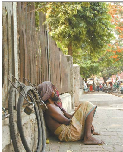
লক্ষ্মীবাজার-এ ক্লান্ত শ্রমিক